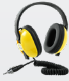
방수 헤드폰 3.5mm EQUINOX 방수 헤드폰